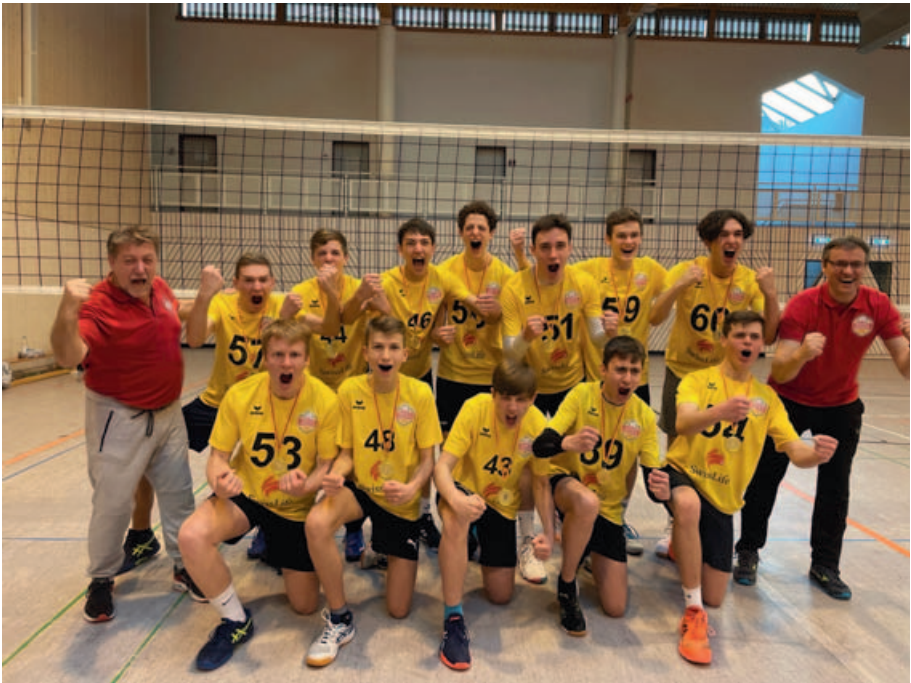
U18 ist Nordbadischer Meister 2022!