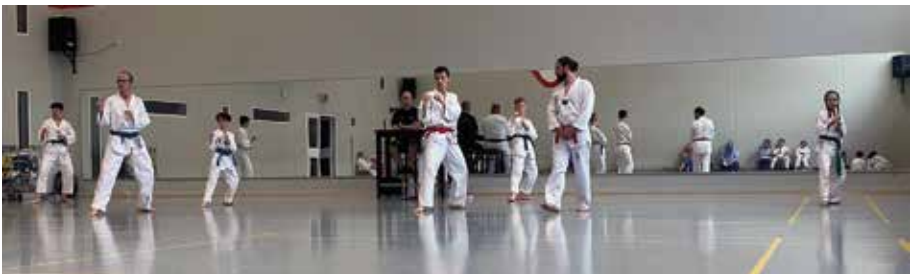
Üben der Grundtechniken gehört zum Training wie auch zur Prüfung.

Taekwondo ist vielseitig und fördert sowohl Fitness als auch mentale Stärke. Du fühlst dich fit, stark, aufrecht und selbstbewusst. Innerhalb der Gemeinschaft fällt