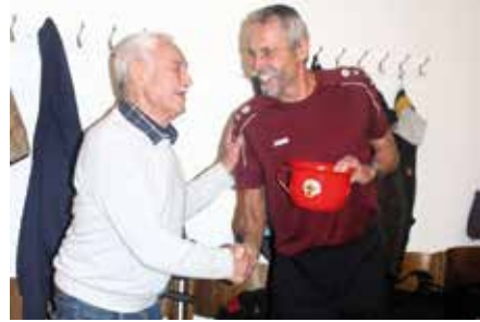
Ein Trostpreis wurde auch vergeben.

Nach so viel Sport beendete der gemütliche Teil einen wunderschönen Abend.