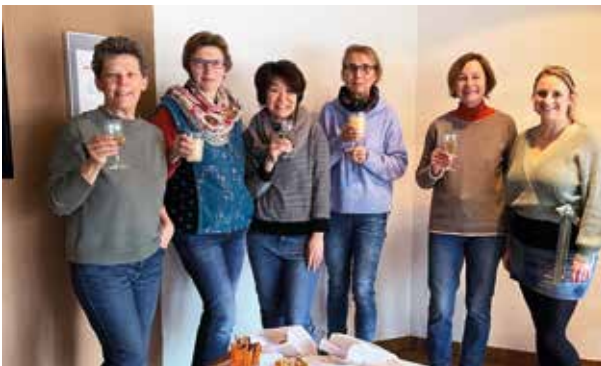
Adressier- und Verteil-Crew 2024

Bei dem Arbeitsgang für das Adressieren und Aufteilen der INFOS auf die jeweiligen Verteilervorgänge war gerade die Gruppe