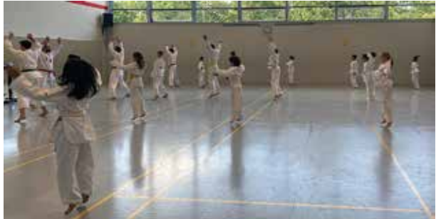
Aufstellung und Warmup in Einem.

du freust dich aufs nächste Training. Als das Gefühl währenddessen und auch auf das Gefühl danach: Etwas Gutes für dich getan zu haben! Die passende Sportart