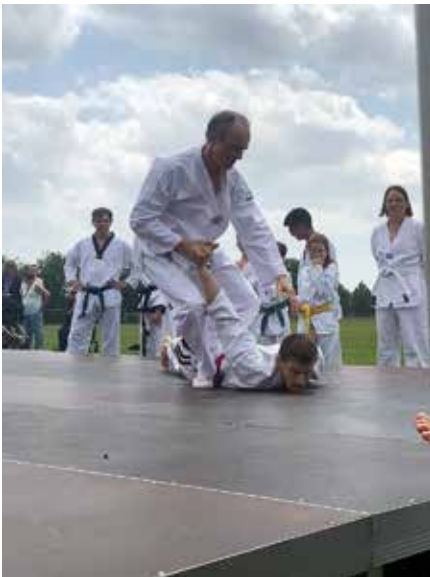
Selbstverteidigung ist ebenfalls ein Bestandteil des Taekwondo-Trainings.

es leichter, sich zu motivieren. Wir unterstützen uns gegenseitig beim Training. Zwei Mal im Jahr gibt es eine Gürtelprüfung und wer will, kann dort den nächsten Grad erlangen.