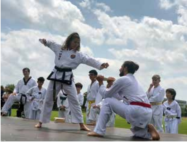
Beim Bruchtest zeigt sich die geistige Konzentration und das perfekte Zusammenspiel von körperlicher und geistiger Leistungsfähigkeit.