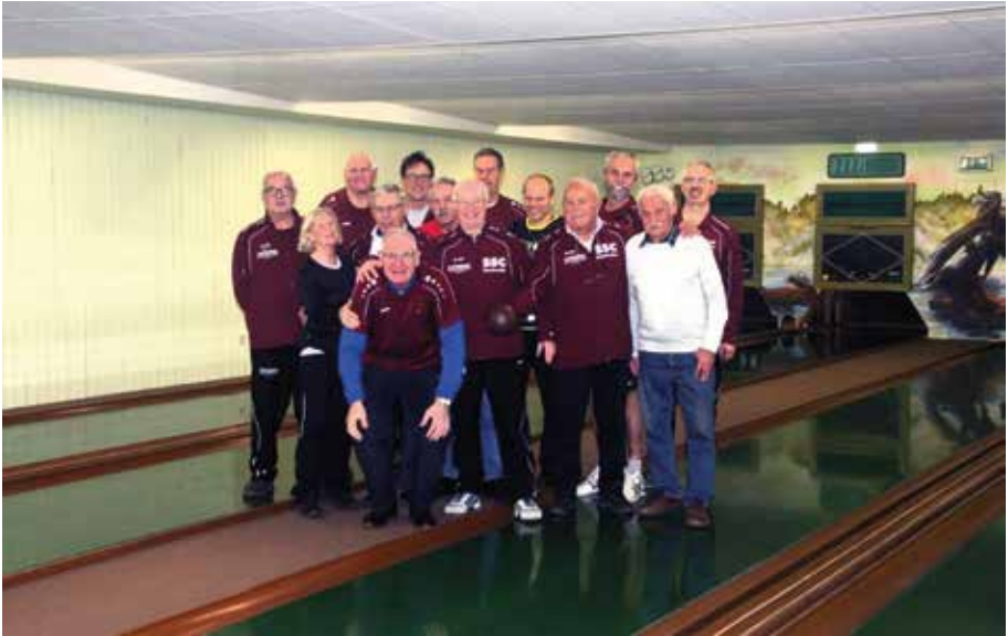
Die Sportkegel Abteilung: Wir freuen uns über Jede und Jeden.