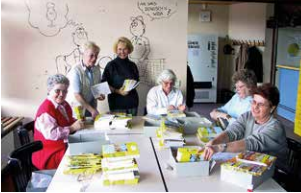
Adressier- und Verteil-Crew 2001

wird und kann von dort runtergeladen werden. Nebenbei: Damit Sie das oben schon erwähnte INFO 2/2001 auch mit dem erwähnten Artikel nachlesen können, ist es als PDF-Datei auf der SSC – Homepage unter Service/ Downloads nochmal abgespeichert!