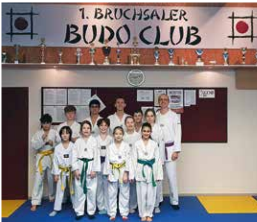
Wir freuen uns auf einen ganztägigen Taekwondo-Lehrgang.