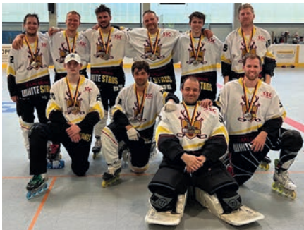
Silber für die White Stags! Unsere 1. Mannschaft sicherte sich den 2. Platz in der Landesliga BaWü 2024

Viktor (i.V. Alex) bereitet das Team auf spannende Einzelspieltage und das große Final4-Playoff-Turnier vor.