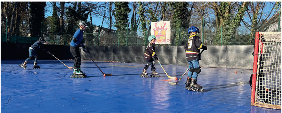
Unsere Nachwuchsspieler*innen zeigen vollen Einsatz beim Training