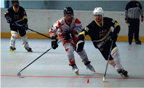
Spannung auf dem Feld: Intensiver Zweikampf während eines Ligaspiels der White Stags