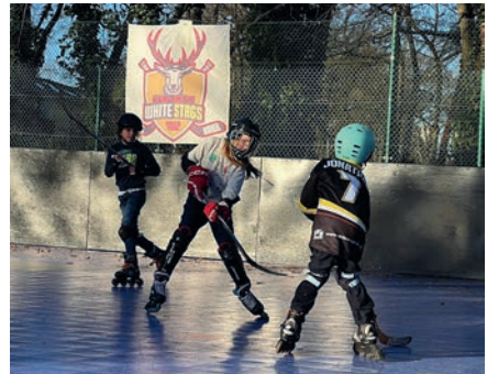
Vor dem White Stags-Banner geht es zur Sache: Wer gewinnt das Duell?